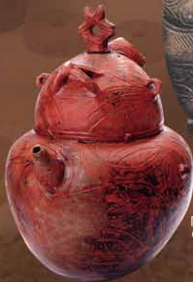
「赤彩注口土器」 (八雲町野田生)