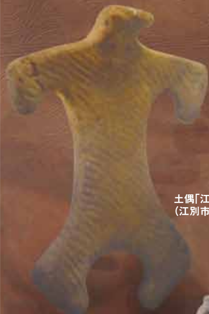
土偶「江別市大麻3遺跡」 (江別市)