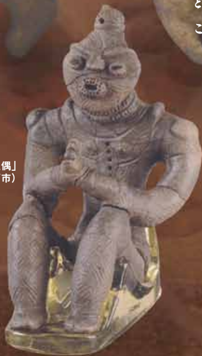
国宝「合掌土偶」 (青森県八戸市)