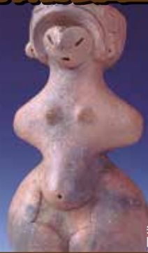
尖石縄文考古館 国宝・縄文のビーナス