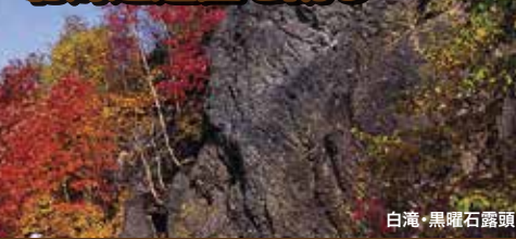
白滝・黒曜石露頭

旅行代金 大人・子ども お一人様 39,800円 ポイント Y1A108 出発日 9/21(月・祝)