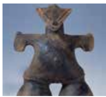
国宝・仮面の女神