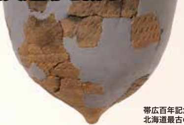
帯広百年記念館 北海道最古の土器

旅行代金 大人・子ども お一人様 32,000円 ポイント Y1A107 出発日 9/11(金)