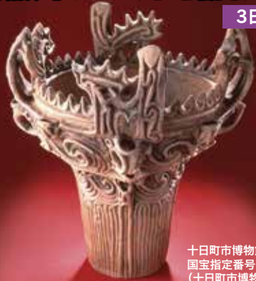
十日町市博物館 国宝指定番号1 (十日町市博物館所蔵)