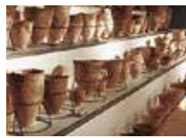
江別市郷土資料館