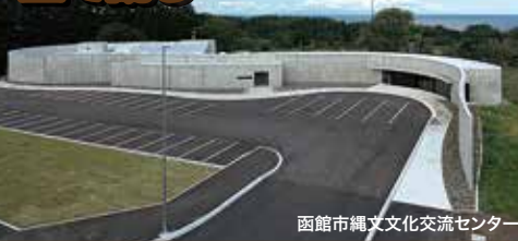
函館市縄文文化交流センター

旅行代金 大人・子ども お一人様 29,800円 ポイント Y1A110 出発日 10/24(土)