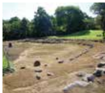
小牧野遺跡(青森市) 縄文時代後期に作られた環状列石を主体とする遺跡で、国指定史跡です。