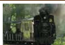
北海道遺産・SL雨宮21号

★白滝で黒曜石の原石山見学と石器づくり体験! ★丸瀬布では北海道遺産のSLに乗り! ★憧れのマウレ山荘に宿泊!