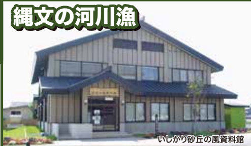
いしかり砂丘の風資料館