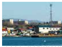
岩内東山円筒文化遺跡(遠望)