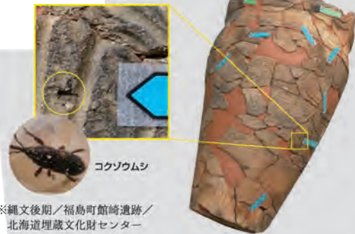
※縄文後期/福島町館崎遺跡/北海道埋蔵文化財センター