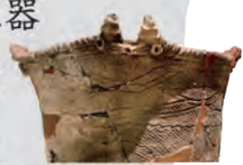
※縄文中期/函館市内浜町A遺跡/市立函館博物館