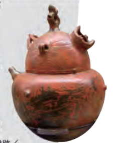
※縄文後期/八雲町野田生1遺跡/八雲町郷土資料館所蔵、北海道埋蔵文化財センター