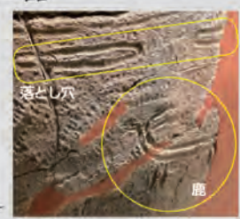
※縄文中期/函館市白尻B遺跡/函館市縄文文化交流センター