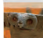
※縄文晩期/千歳市美々4遺跡/北海道埋蔵文化財センター