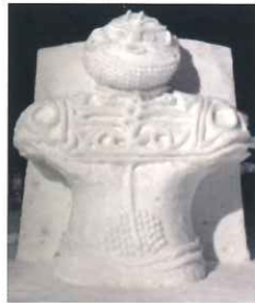
▲「発掘！中空土偶」(2017・冬)

今年で4年連続となりました！さっぽろ雪まつりに土偶が出現！？何を作るかお楽しみに！！