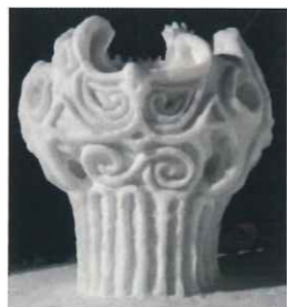
▲「燃えよ！火焰土器」(2019・冬)