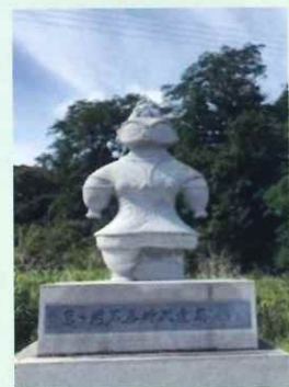
亀ヶ岡遺跡にある遮光器土偶のモニュメント