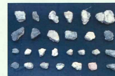
無文土器の小さなカケラについて炭素(= 焦げ)による年代測定で15000年前頃のものだと確認された

なぜこの地で縄文黎明期の定住生活が始まったのか、というのが私にとって最大の疑問でした。当時はまだ氷期が終わったばかりで、今よりも海からは遠かったと思いますので、交易に便利だったということはあまり考えられませんが、遺跡の側を流れる川で石器の材料となる良質な頁岩が採れ、遡上する魚が捕れたというのが答えでした。特に、昨年度内2番目の国宝となる黒曜石製品の産地である遠軽町白滝や映画「掘る女」の舞台の一つ