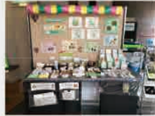
豊富な体験メニュー

特に白滝遺跡群の発掘調査に携わったことから、玄関の外 には白滝産黒曜石の大きな原石が、 中に入ると巨大な石器オブジェがお 出迎え！体験メニューや期間限定の 企画展などもあり、子どもたちや初 心者も楽しめます。