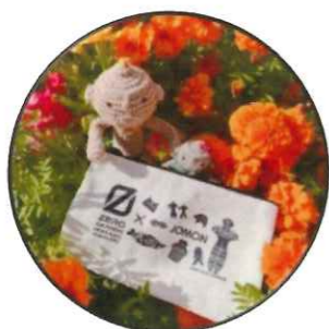
▲こちらも大人気だったコラボポーチ

また、会場では、家庭からのCO 2 排出量をグラフで見える化できるアプリ「北海道ゼロチャレ！家計簿」インストールの方にドニワ部デザインの「ゼロカーボン×JOMON コラボポーチ」がもらえるキャンペーンも実施し、多くのみなさまにインストールいただきました！