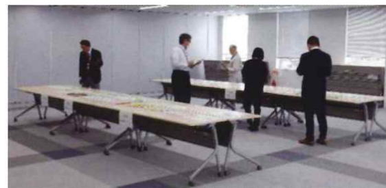
こちらは審査会の様子です！

応募作品45点の中から厳正な審査の結果、最優秀賞1点、優秀賞6点を決定し、胆振総合振興局等で配布予定です。