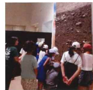
入江・高砂貝塚館見学