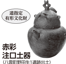
赤彩 注口土器 (八雲町野田生1遺跡出土)