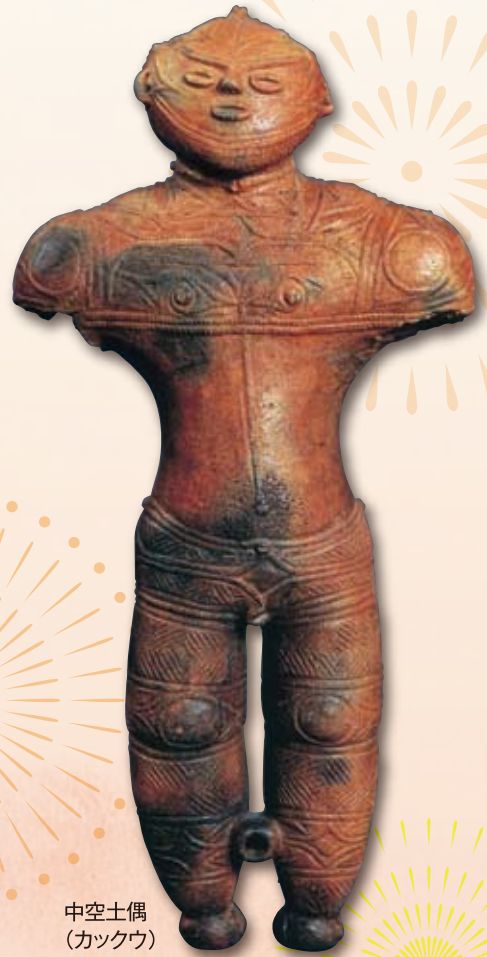
中空土偶 (カックウ)