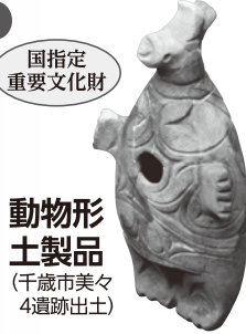
動物形 土製品 (千歳市美々 4遺跡出土)