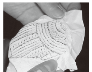
縄文土器拓本の完成